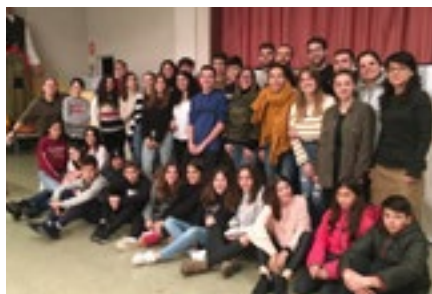
Participants del Fòrum Jove