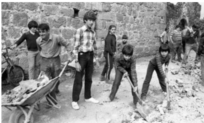
Camp de neteja de l'Estada Juvinya. 1983