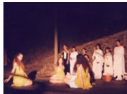
Fragments de la primera aparició de les Dones d'Aigua al llit del Fluvià el 2024.

tori i que afavorís les interrelacions amb artistes i altres serveis del municipi i de la comarca. Des del primer moment, es va concebre com una activitat anual i permanent vinculada al nostre poble.