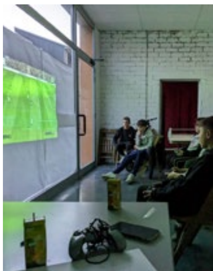
Algunes de les activitats desenvolupades a l'Espai Jove de la Canya.