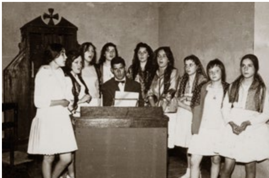
Coral parroquial. 1960